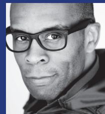
Denzal Sinclair Chanteur jazz